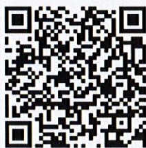
เอกสารประกอบการประชุม